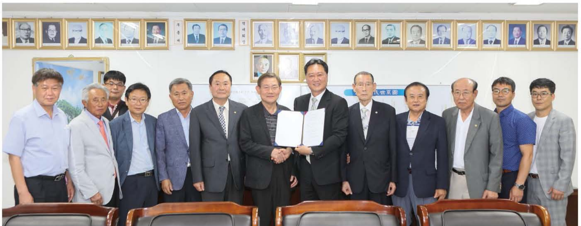
2020년 6월 24일 경주이씨 중앙화수회(한글대종보편찬회)와 한국족보편찬위원회간의 한글대종보편찬 계약