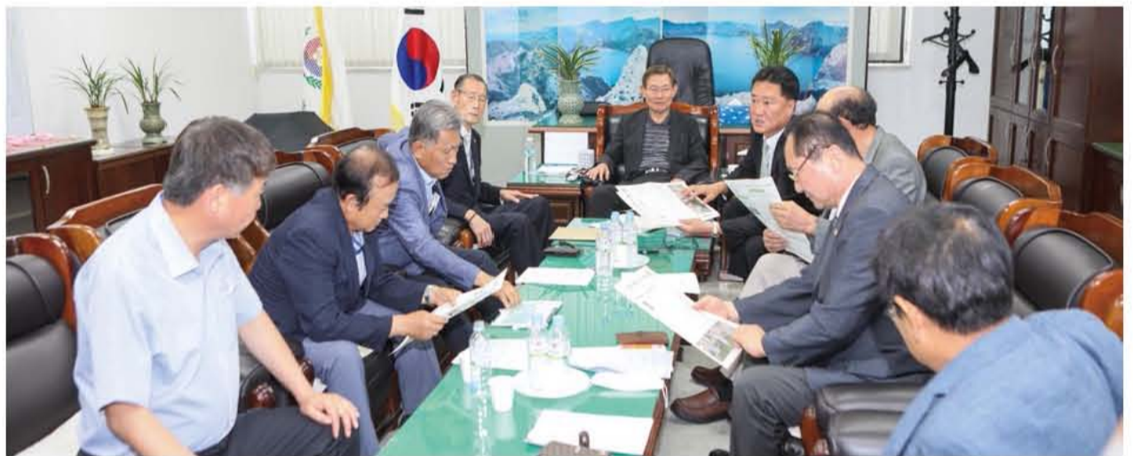
계약사항 최종 점검과정 회의