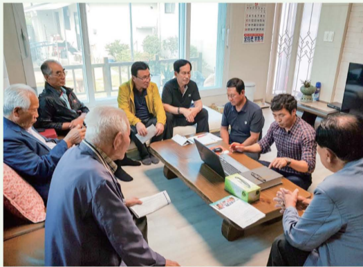
▲ 집성촌 현장 수단 (마을회관, 문중재실 등에서 수단자료 접수)